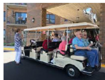
People mover 2