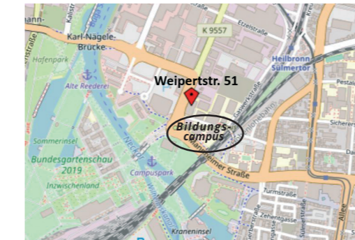
Karte hergestellt aus OpenStreetMap-Daten | Lizenz: Open Database License (ODbL)

Als Navigationsadresse die Weipertstraße 51, 74076 Heilbronn eingeben.