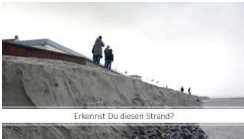
Erkennst Du diesen Strand?

Narrativ: Vor zwei Jahren habe ich Urlaub mit meinen Eltern gemacht auf Wangerooge. Ich erinnere mich noch an die Gespräche mit einem Inselbewohner, der mir erzählte, wie paradiesisch dieser Strand aussähe wenn nicht mal wieder eine Sturmflut die Hälfte weggetragen hätte. Auch als wir die Insel wieder verlassen konnten wir erste Anzeichen der Hintergrundarbeiten sehen: Schwere Bagger, die auf den Strand gefahren